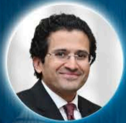
ALI PERVAİZ MALİK Pakistan Petrol İşlerinden Sorumlu Enerji Bakanı