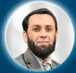
ATTAULLAH TARAR Pakistan Bilgi ve Yayıncılık Bakanı