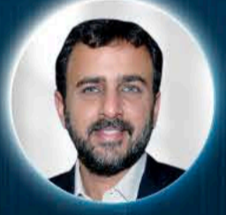
SARDAR AWAIS AHMAD KHAN LEGHARI Pakistan Elektrik İşlerinden Sorumlu Enerji Bakanı