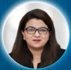
SHAZA FATİMA KHAWAJA Pakistan Bilişim ve Telekomünikasyon Bakanı