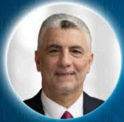
PROF. DR. ÖMER BOLAT Türkiye Cumhuriyeti Ticaret Bakanı