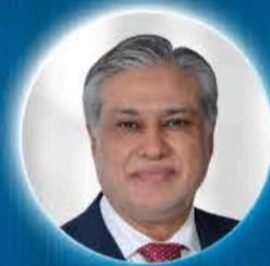
MUHAMMAD ISHAQ DAR Pakistan Başbakan Yardımcısı ve Dışişleri Bakanı