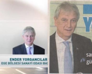
ENDER YORGANCILAR EGE BÖLGESİ SANAYİ ODASI BAŞKANI