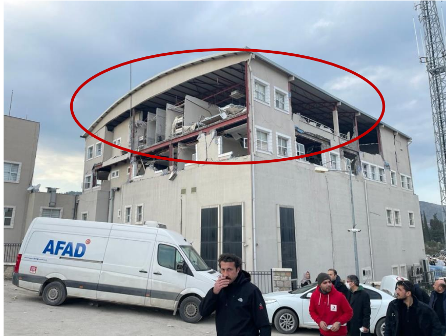
HASAR GÖREN AFAD BİNASI