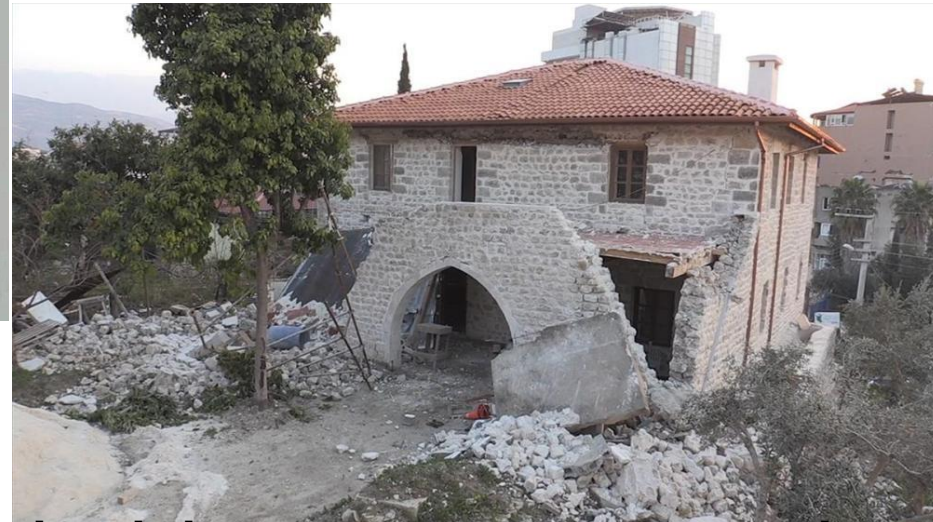
İNGİLİZ PROTESTAN MEKTEBİ