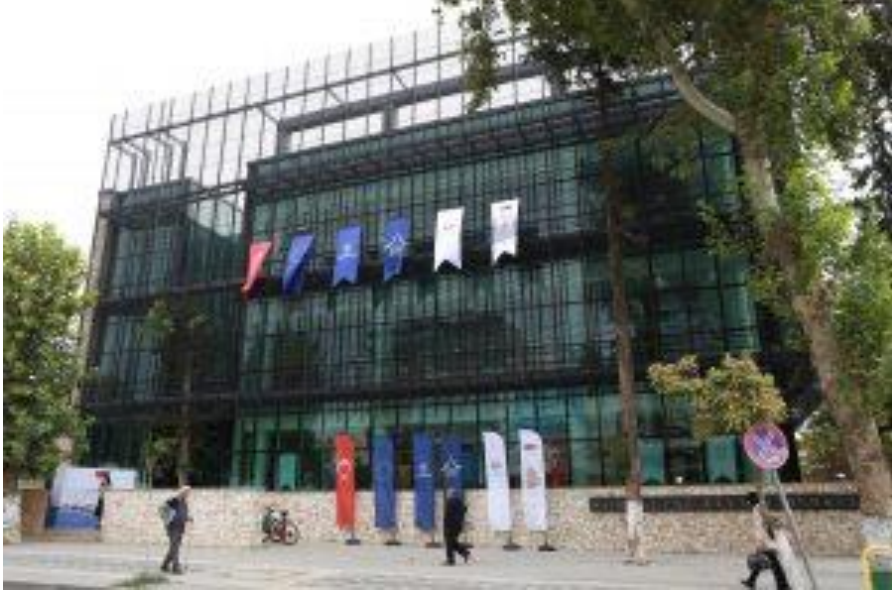
ADİYAMAN KÜLTÜR MERKEZİ