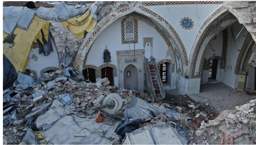
14 ASIRLIK HABİB-İ NECCAR CAMİ