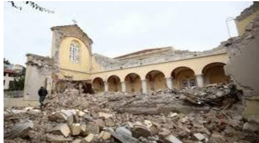
İTALYAN, LATİN KATOLİK KİLİSESİ