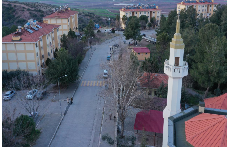
HATAY TOKİ KONUTLARI