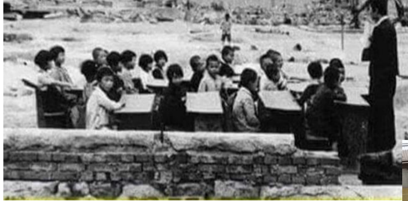
ATOM BOMBASINDAN SONRA