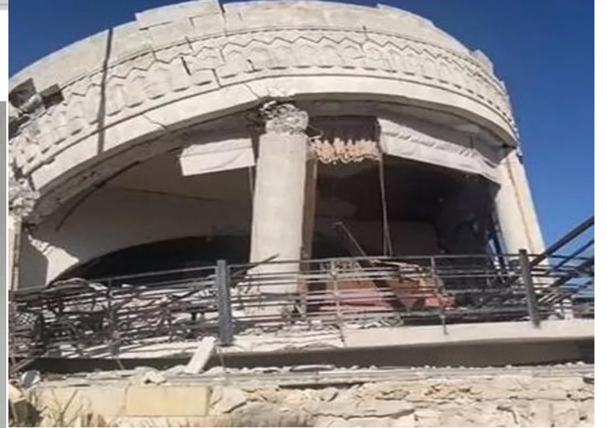
HATAY DEVLET MECLİS BİNASI