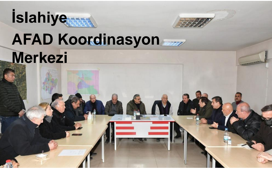
İslahiye AFAD Koordinasyon Merkezi