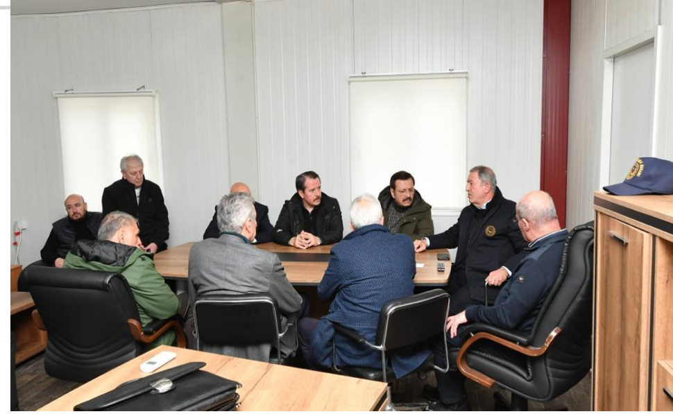
Antakya Milli Savunma Bakanı Hulusi AKAR