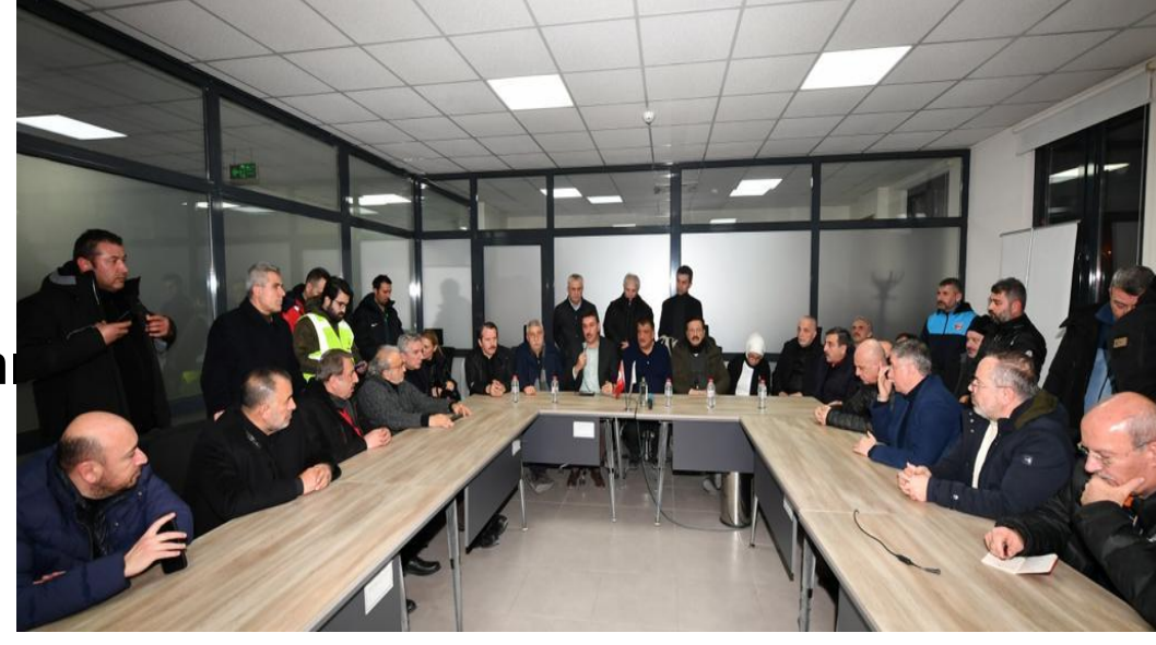
Malatya 64. ve 65. Hükümet Gümrük ve Tic. Bakanı Bülent TÜFENKÇİ