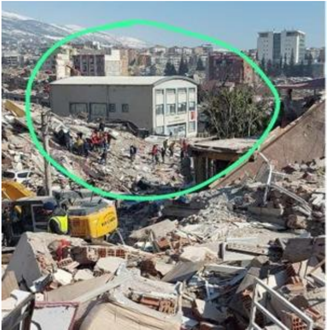
K.MARAŞ İNŞAAT MÜHENDİSLERİ ODASI