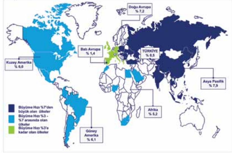
Dünya İnşaat Sektörü Büyüme Beklentisi, 2009 – 2014

Raporda, Türk inşaat malzemeleri sektörünün gelecekte büyümeyi yönetebilmek için çeşitli stratejik inisiyatiflere odaklanması öneriliyor. Bu stratejik kararlar şöyle sıralanıyor.