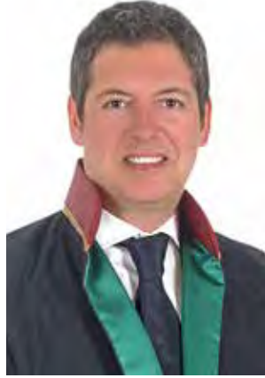
Av. Murat Ulu Hukuk Danışmanı

Yukarıda belirttiğimizimizin dayanağını ise herhangi bir yasal düzenleme değil, Mahkeme kararları oluşturmaktadır. Konuyla ilgili Mahkeme kararlarının temyiz incelemesini yapan Yargıtay 3. Hukuk Dairesinin artık istikrar kazanmış uygulamasında yer verilen Yargıtay Hukuk Genel Kurulu'nun 21/05/2014 gün, 2013/7-2454 Esas- 2014/679 Karar sayılı kararında belirtilen şudur;