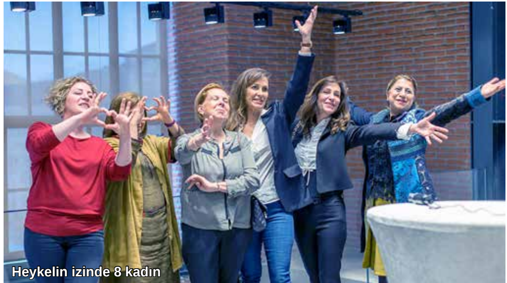
Heykelin izinde 8 kadın

İzmir'in yeni yaşam merkezi Mahall Bomonti İzmir, kentin kültür ve sanat hayatına hareket getirdi. İzmirli sanatseverler, tarihi Bomonti Tesisleri'nde özel konseptle hazırlanan mekânlarda düzenlenen sergilerde birbirinden değerli sanatçıların eserlerini görme fırsatı yakalıyor. Eylül ayından bu yana seri şekilde düzenlenen sergilerin en yenisi dev bir sanatçının, Devrim Erbil'in imzasını taşıyor.