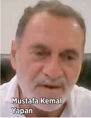
Mustafa Kemal Yapan