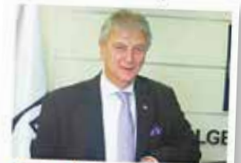
Ender Yorgancılar: 15 Temmuz unutulmayacak

su, varlığımızın sebebi, Ulu Önder Mustafa Kemal Atatürk'ün bizlere emanet ettiği laik Türkiye Cumhuriyeti'ni korumak güçlerimizi arındırarak, daha ileriye taşımak, geleceğimizi akıl ve bilimin ışığında daha nitelikli yetiştirmek gayesi için elbirliği ile çok çalışmalıyız. 15 Temmuz şehitlerimizle bir kez daha Allah'tan rahmet, ailelerine sabır diliyoruz, gazilerinizi minnetle anıyoruz.